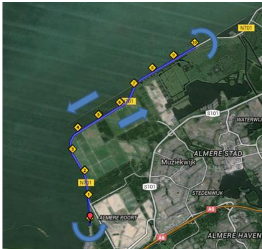
Fietsparcours DUIN NK Duathlon

Deelnemers aan de Lange afstand fietsen 3 keer heen-en-weer.