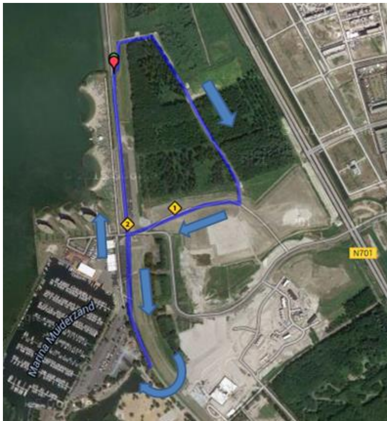
Loopparcours DUIN NK Duathlon en DUIN Triathlon

De Olympische afstand loopt vier rondes van 2,5 kilometer.